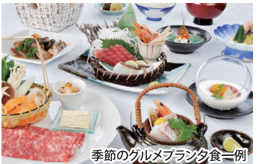
季節のグルメプラン夕食一例