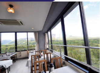
8階展望レストランからは那須連山を望むことができます。