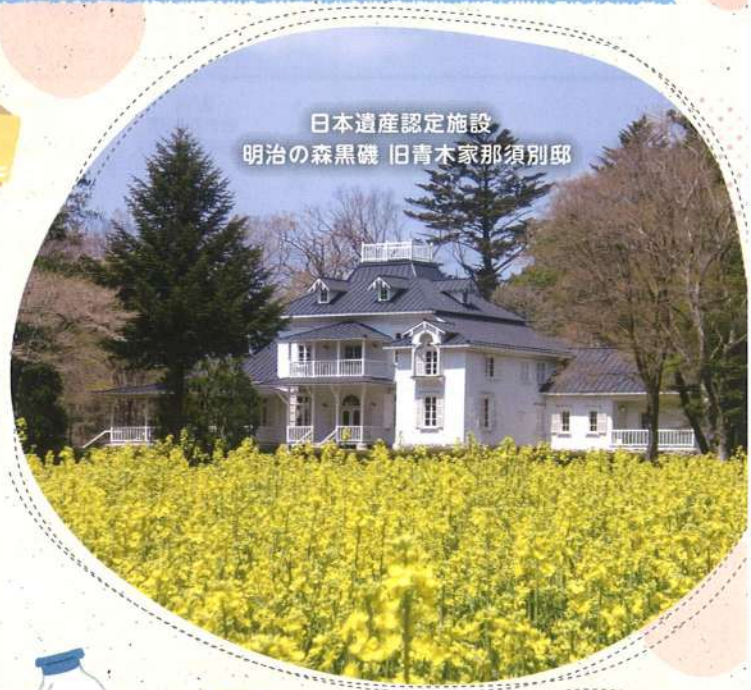
日本遺産認定施設 明治の森黒磯 旧青木家那須別邸