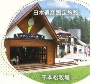
日本遺産認定施設